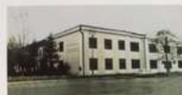
Первое здание Уфимской школы музыковоспитанников Офи музыкант тарбаилануселлерге тауус мактап бинасы