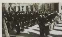
На параде учащиеся школы музыковоспитанников. 1956 г. Музыканты тарбаилануселлер парады. 1956 й.